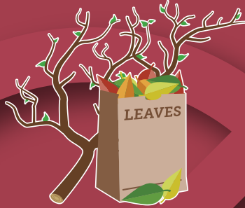
Yard Waste Desperdicios del césped