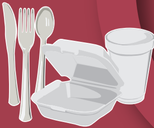
Styrofoam & Plastic Utensils Utensilios de polietileno y plástico