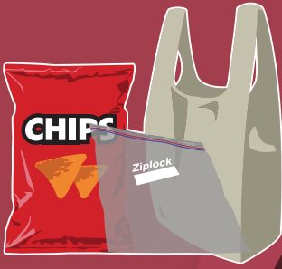
Plastic Bags & Film Bolsas y material de plástico