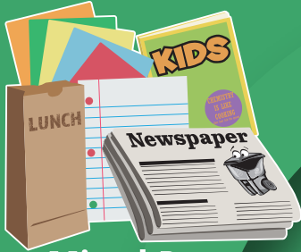
Mixed Paper Papel Variado