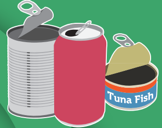
Metal Cans Latas Metálicas