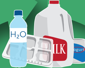
Plastic Containers (#1-7) Envases Plásticos (#1-7)