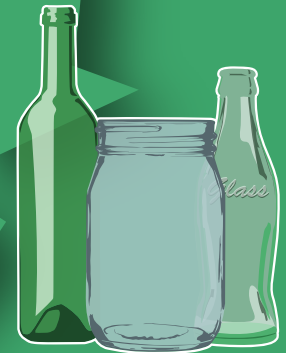
Botellas de Vidrio