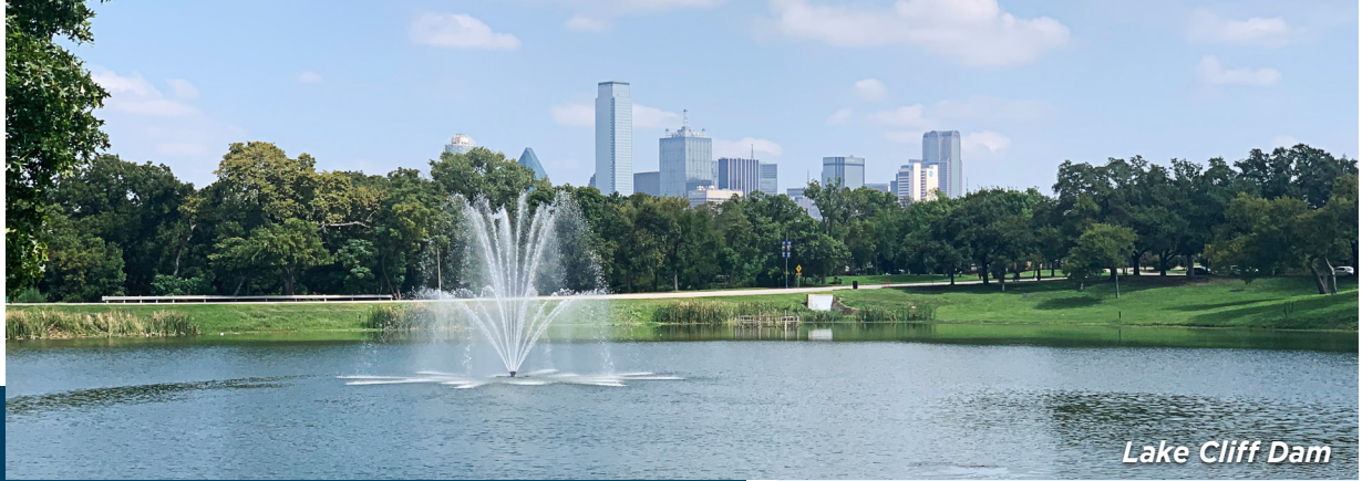
Lake Cliff Dam

Los Servicios de Agua y el Departamento de Parques y Recreación de la Ciudad de Dallas invitan a los residentes y empresas a participar en las Reuniones Públicas Virtuales de Difusión Pública de Seguridad de Represas.